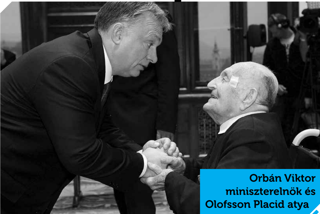
Orbán Viktor miniszterelnök és Olofsson Placid atya

• Az indoklás szerint a díjat a kivételes élethivatását a legembertelenebb körülmények között is reményt adó derűvel megélő, a sokféle megpróbáltatás ellenére is töretlen és lelki-