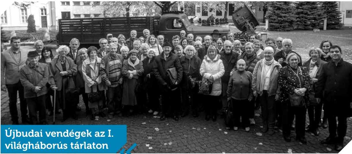
Újbudai vendégek az I. világháborús tárlaton

Közel hetven újbudai polgár látogatott el Simicskó István honvédelmi miniszter, Újbuda országgyűlési képviselője meghívására a Hadtörténeti Intézet és Múzeum tárlatára október 26-án. Az I. világháborús kiállításon korabeli újsághíreket, dokumentumokat, fotókat, térképeket, fegyvereket és egyenruhákat mutattak be az érdeklődőknek. Az eseményen egy, a Nagy