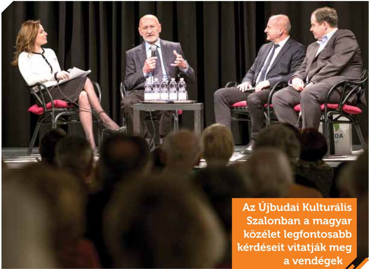
Az Újbudai Kulturális Szalonban a magyar közélet legfontosabb kérdéseit vitatják meg a vendégek