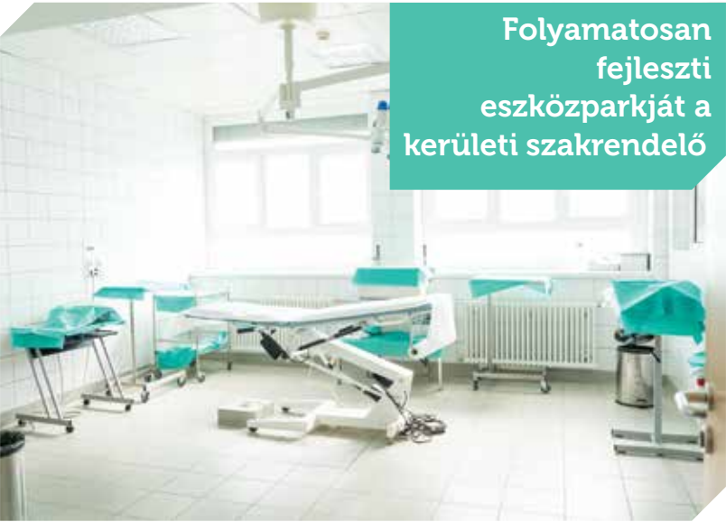
Folyamatosan fejleszti eszközparkját a kerületi szakrendelő

Szabolcs Attila Újbuda példaértékű egészségügyi ellátórendszerére hívta fel a figyelmet. Az országgyűlési képviselő szerint a helyi lakosok kivételesen jó helyzetben vannak, hiszen a magas fokú szakmai munka mellett a berendezésekről, a fejlesztésekről és a megfelelő munkakörülményekről is kellőképpen gondoskodik az önkormányzat.