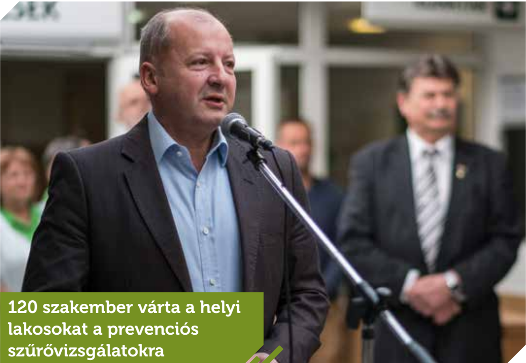
120 szakember várta a helyi lakosokat a prevenciós szűrővizsgálatokra