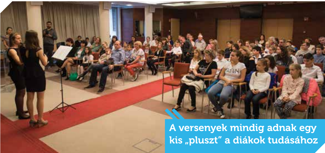
A versenyek mindig adnak egy kis „pluszt” a diákok tudásához