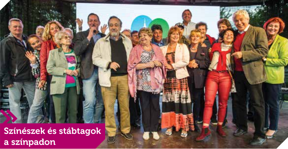
Színészek és stábtagok a színpadon

állomások legjobbjai pedig a Szomszédok legnagyobb rajongója címet is megkapták. A Szomszédok Ünnepé kezdeményezéshez olyan cégek is csatlakoztak, amelyek termékei már harminc éve nagy népszerűségnek örvendtek. Ki ne emlékezne szeretettel a tömlős Camping sajtra vagy a Velmetina hajápoló szerekre? A Caola retrótermékekből összeállított kiállítás szintén a '80-as évek hangulatát idézte.