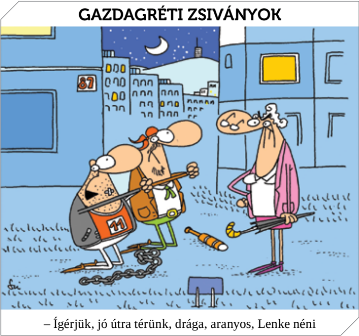
– Ígérjük, jó útra térünk, drága, aranyos, Lenke néni