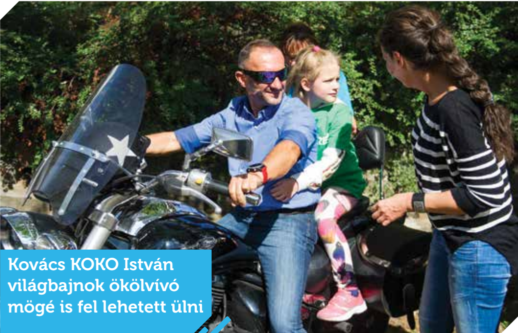
Kovács KOKO István világbajnok ökölvívó mögé is fel lehetett ülni

Hetedik alkalommal tartottak játékonysági motoros rendezvényt a Pető Intézet lakóinak. A Négy kerékről két kerékre elnevezésű eseményen mintegy 100 mozgássérült gyermeket vittek végig „vad motorosok” Budapest utcáin.