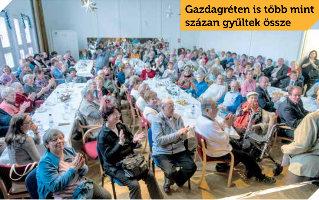
Gazdagréten is több mint százan gyűltek össze