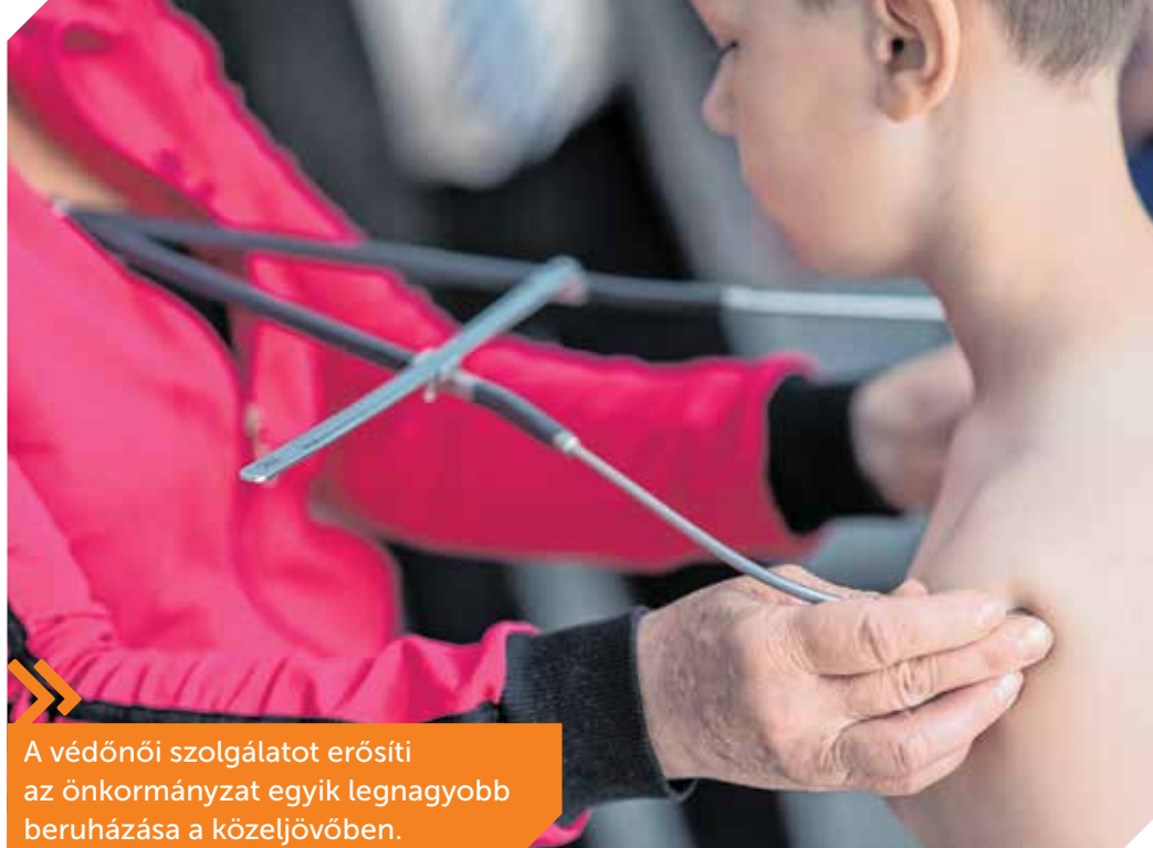
A védőnői szolgálatot erősíti az önkormányzat egyik legnagyobb beruházása a közeljövőben.

polgármester. Ennek érdekében csak 2017-ben közel 377 millió forint értékben újultak meg rendelőik, szereztek be eszközöket a kerületben önkormányzati forrásból. Ultrahang- és röntgenberendezések érkeztek a Szent Kristóf Szakrendelőbe, háziorvosi rendelők