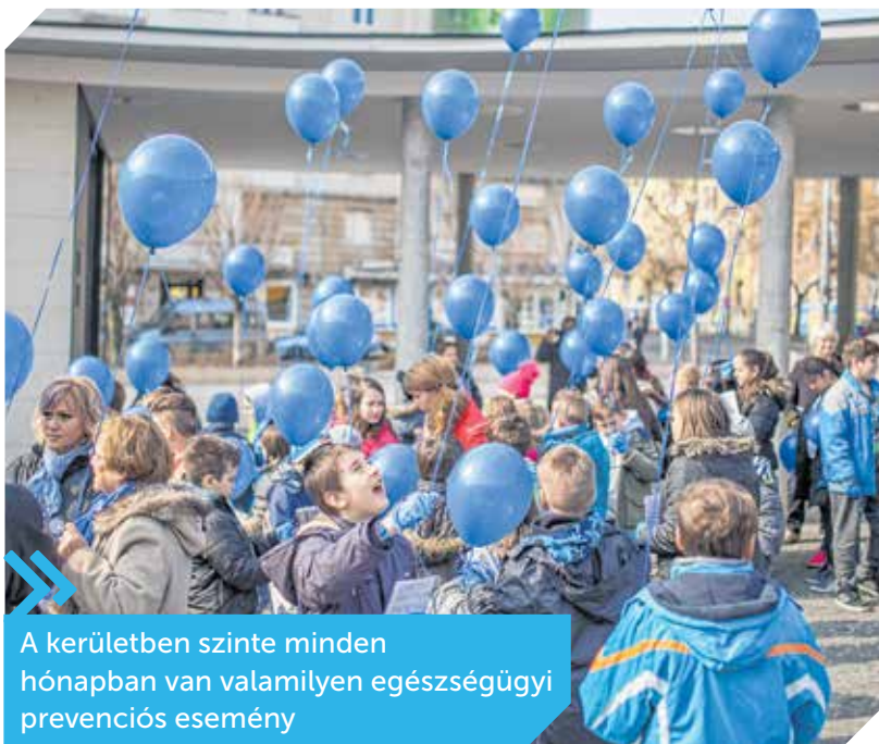
A kerületben szinte minden hónapban van valamilyen egészségügyi prevenciósi esemény

sak, mert így a szakorvosi gárda is jobb körülmények között tud dolgozni, ez pedig segít abban, hogy az orvosok hosszú ideig, stabilan a szakrendelő kötelekében maradjanak, biztosítva a zökkenőmentes betegellátást, ami nélkülözhetetlen egy olyan rendelőben, ahol évi 800 000 orvos-beteg találkozás történik.