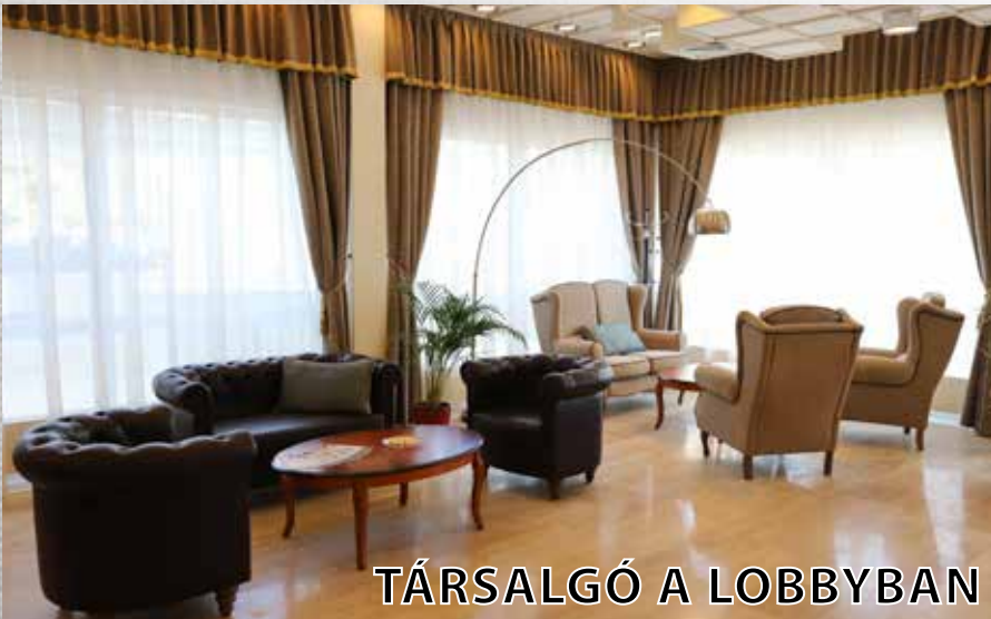
TÁRSALGÓ A LOBBYBAN