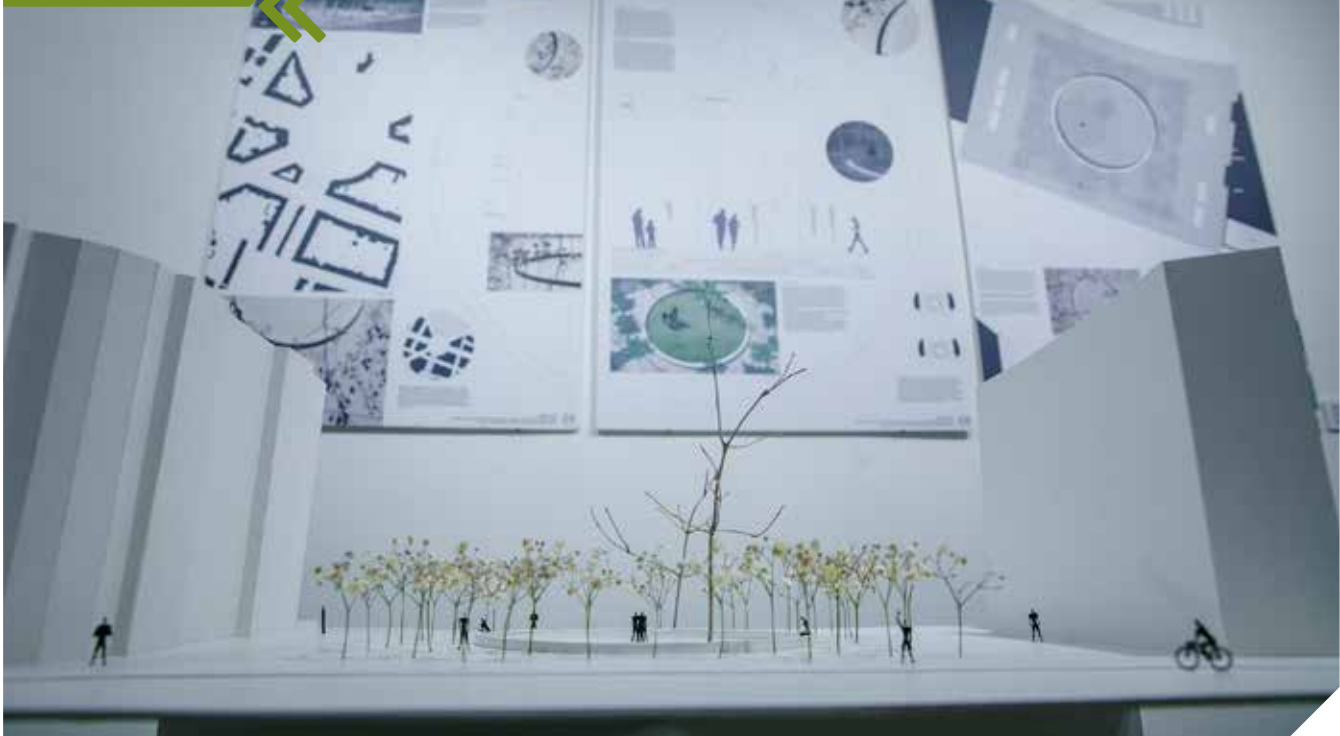
A pályázat második helyezettje

letén olyan művészek laktak és alkottak, mint Kosztolányi mellett például Karinthy Frigyes vagy Móricz Zsigmond, a Hadik-házban festő Csontváry Kosztka Tivadar, a zeneszerző-énekes Cseh Tamás. A 20. század eleji hőskor után jó ötven esztendővel újra otthonra talált itt a művészet, és a városrész megkerülhetetlen