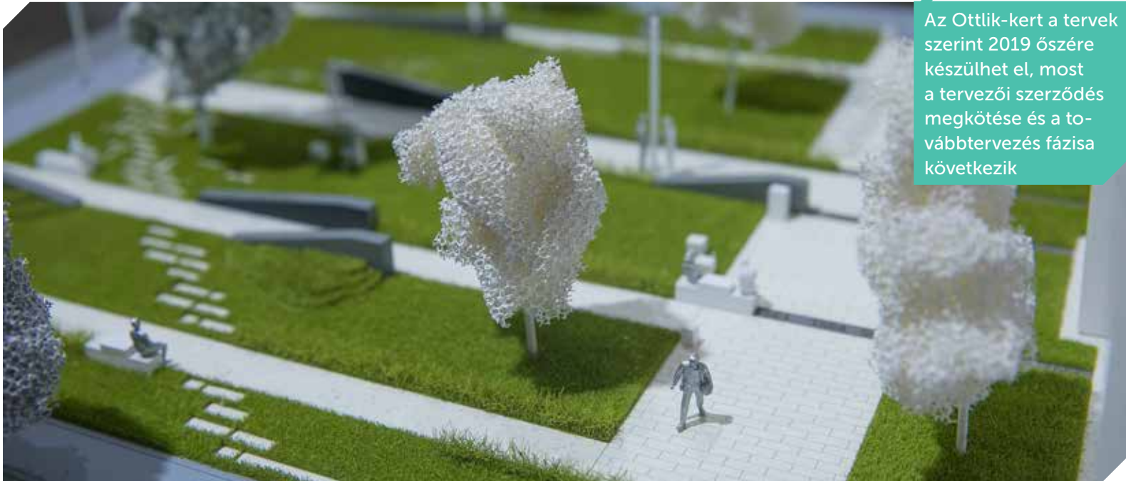
Az Ottlik-kert a tervek szerint 2019 őszére készülhet el, most a tervezői szerződés megkötése és a további tervezés fázisa következik