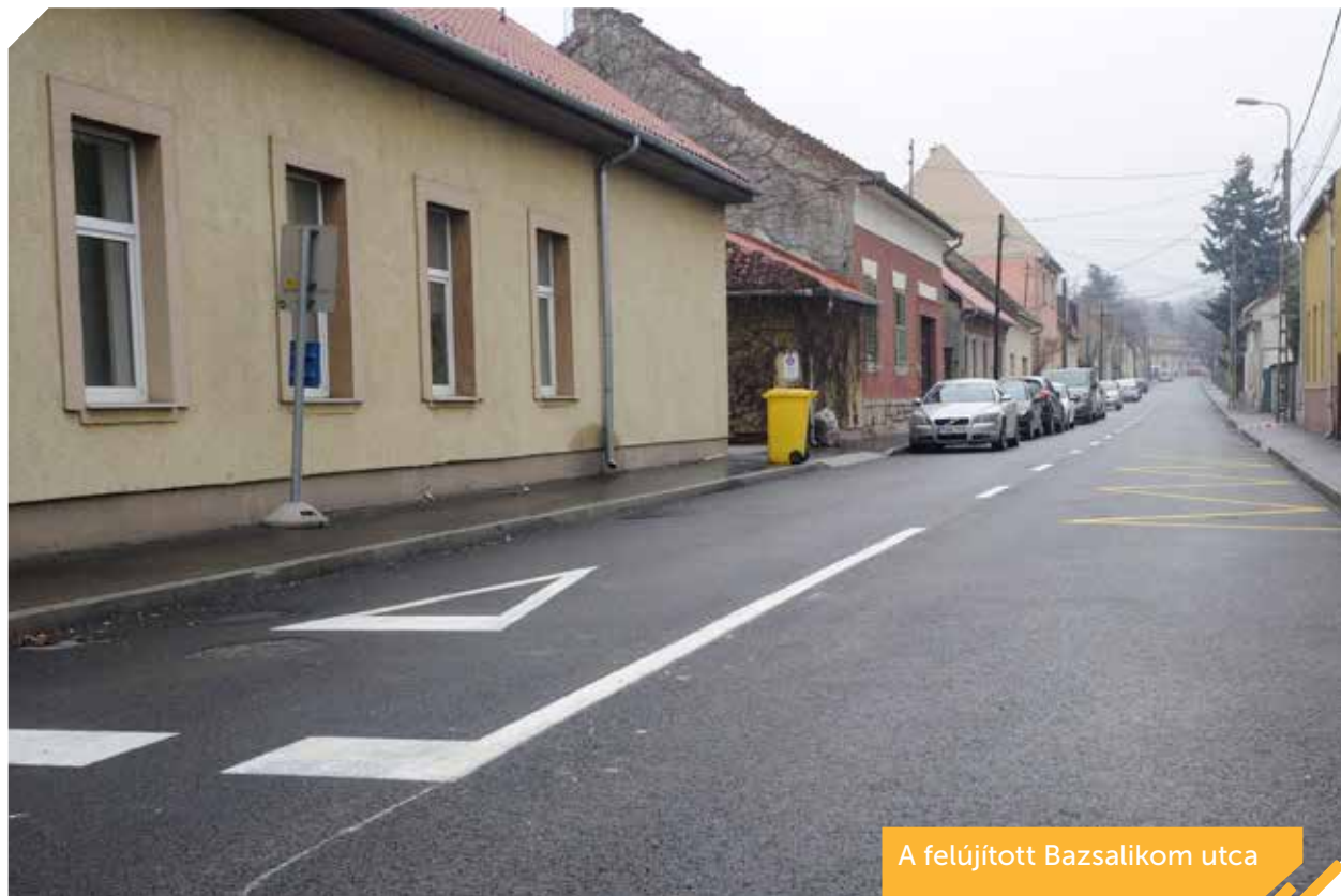
A felújított Bazsalikom utca

Idén áprilisban újabb reortán futópályával gazdagodott a kerület. A Hamzsabégyi úti beruházás első ütemében háromszáz méteres szakasz készült el, a második