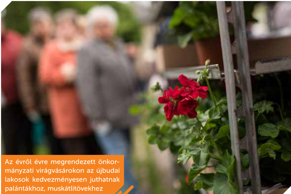
Az évről évre megrendezett önkormányzati virágvasárokon az újbudai lakosok kedvezményesen juthatnak palántákhoz, muskátliövekhez