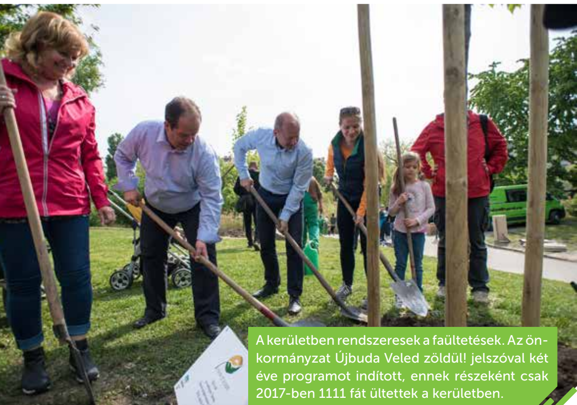
A kerületben rendszeresek a faültetések. Az önkormányzat Újbuda Veled zöldül! jelszóval két éve programot indított, ennek részeként csak 2017-ben 1111 fát ültettek a kerületben.

Újbudán számos szépen kiépített, jó infrastruktúrával rendelkező parkot és teret találunk a pihenésre, zöld környezetre vágyók. Tavaly év végén adták át a felújított Gazdagréti teret, amelyre az önkormányzat 140 millió forintot nyert el a főváros Tér-Köz 2016-os pályázatán, több mint százmilliót pedig saját forrásból fordított rá. Az volt a cél, hogy a Gazdagréti tér valós fogadótérre váljon, az egészséges zöld környezet érdekében pedig a meglévő fák mellett újakat telepítettek, közösségi díszkerteket alakítottak ki. Hamarosan kizöldül az Etele út is, miután befejeződik az 1-es vilamos vonalának meghosszabbítása az Etele térig. A mintegy 1,7 kilométeres, teljes hosszában fűvesített pálya az Etele út közepén megy végig, a környezetben több száz fát és több ezer cserjét ültetnek el. A korábban felújított parkok, zöld területek között igen népszerű a fővárosi kezelésben álló Feneketlen-tó környéke, a Hamzsabégi úti sétány, a Bikás park. Utóbbi látogatói közül nem mindenki tudja, hogy biotó mellett sétál el, amelyben nem használnak mesterséges