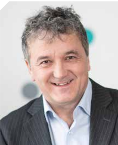
Ízelítő a Pont magazin februári számából