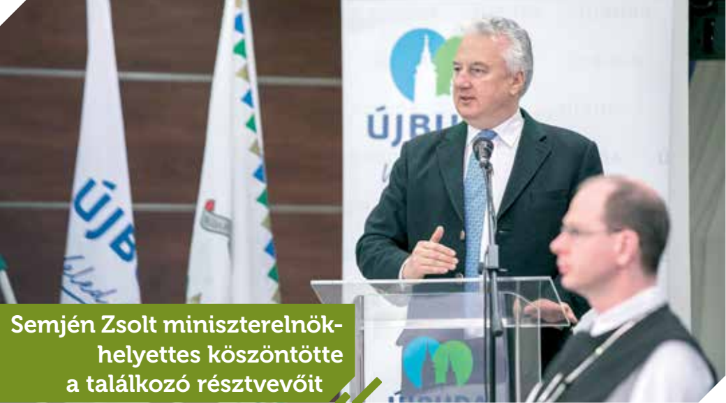
Semjén Zsolt miniszterelnök-helyettes köszöntötte a találkozó résztvevőit

Szentek templomában, modernizálták a díszvilágítást a gellérthegyi pálos Sziklatemplom fölött, elkezdődött a Bencés Tanulmányi Ház felújítása. Kiemelte, hogy az egyházak és szervezetek az önkormányzattól is évente kapnak támogatást, ebből általában állagmegóvási, felújítási és kisebb beruházási terveiket tudják megvalósítani. A nagyobb beruházások azonban túlmutatnak a kerület lehetőségein, ezekhez fővárosi, kormányzati támogatás is kell. A kerület vezetője arra is kitért, hogy Újbudán több ezer gyermek tanul egyházi intézményekben, de jelentős a felekezetek szociális, karitatív tevékenysége is, ezekhez is igyekszik segítséget nyújtani az önkormányzat.