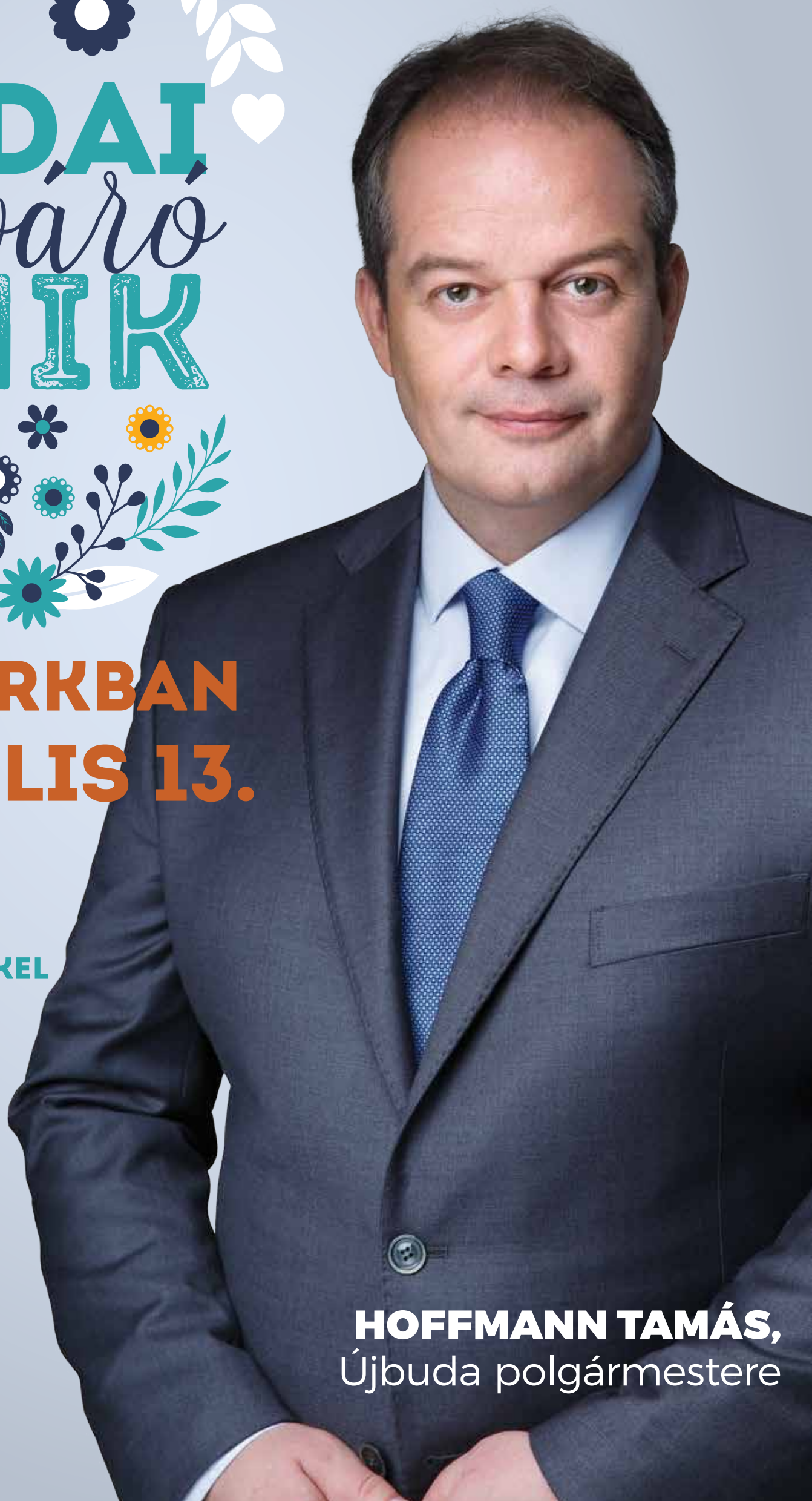
HOFFMANN TAMÁS, Újbuda polgármestere

Készült Újbuda Önkormányzata megbízásából Kiadó: KözPont Újbudai Kulturális, Pedagógiai és Média Kft. 1113 Budapest, Zsombolyai u. 5.