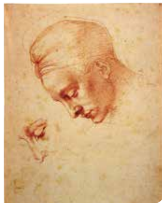
Szépművészeti Múzeum, Michelangelo Buonarroti Casa-Buonarroti Firenze

Giorgio Vasari, az első valódi művészettörténeti könyv írója 1550-ben adta ki A legkiválóbb festők, szobrászok és építészek élete című munkáját, amelyben a szerző – jó firenzei lokálpatriótaként – Leonardo da Vinci mellett elsősorban Michelangelót dicséri.