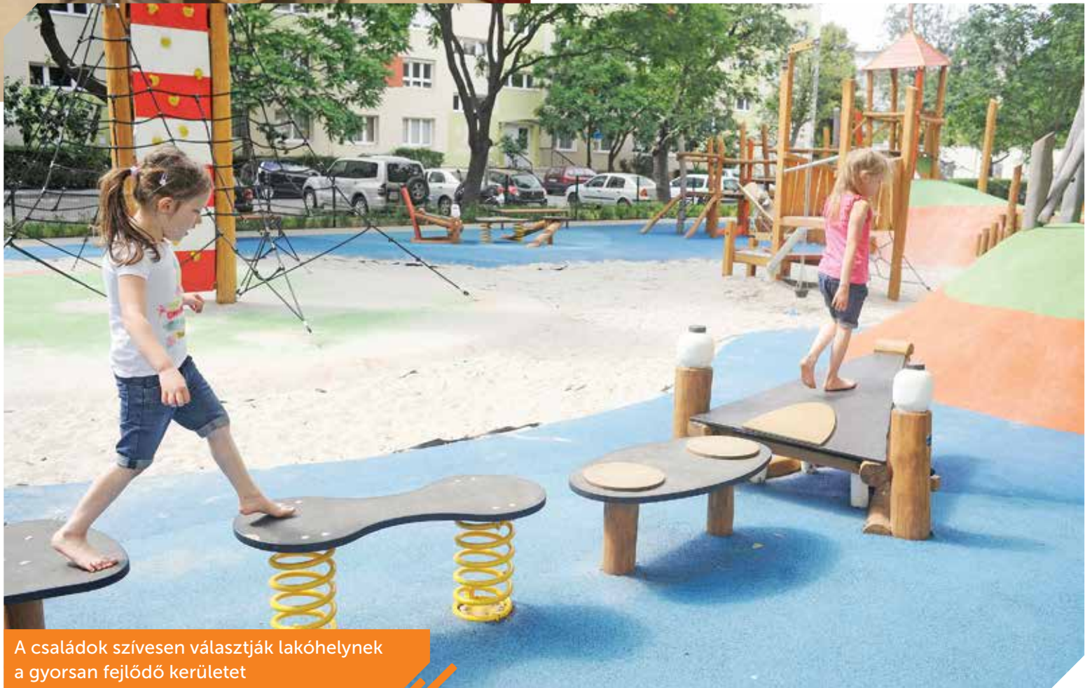
A családok szívesen választják lakóhelynek a gyorsan fejlődő kerületet

– Újbudán a családok az elsők. Ez nem egyfajta politikai szlogen, hanem a mindennapi működésünk része. Azért dolgozunk, hogy itt jó legyen gyermeknek, szülőnek, nagyszülőnek lenni. Az elmúlt években világos stratégia mentén haladva megteremtettük egy jól működő intézményrendszer alapjait. Ennek a munkának részei az infrastrukturális beruházások, a kulturális és közösségi események, sportversenyek, a különböző szemléletformáló programok egyaránt – mondta Hoffmann Tamás . Újbuda polgármestere kiemelte: a kerületben hisznek abban, hogy a valódi pedagógiai munka túlmutat az egyes irányelveken és módszerekken, és elsősorban a gyerekek és szüleik igényeiről szól. – Mi ehhez adunk meg