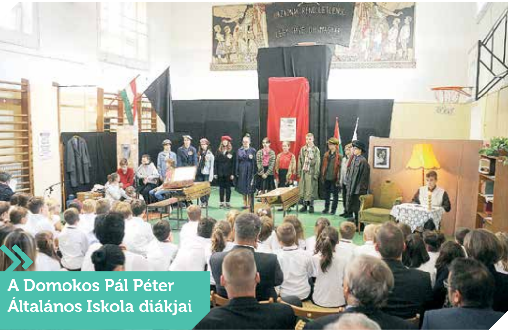
A Domokos Pál Péter Általános Iskola diákjai