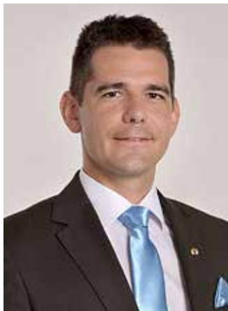
NOVÁK ELŐD Mi Hazánk