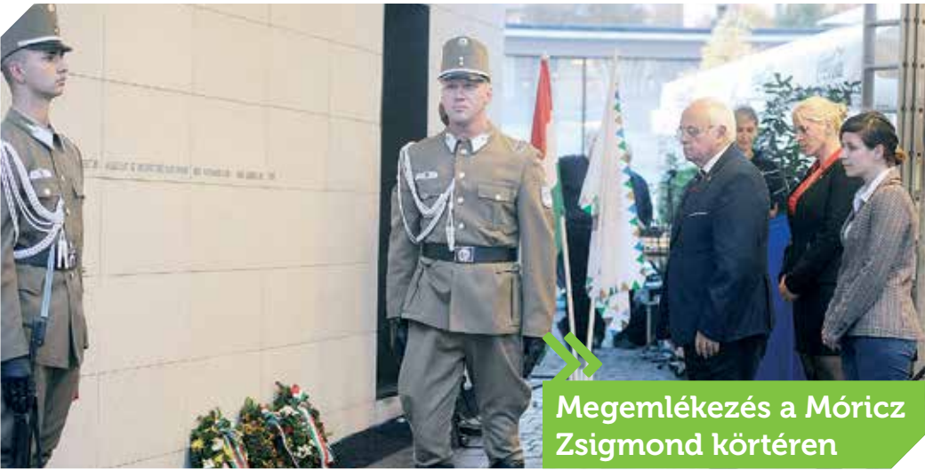
Megemlékezés a Móricz Zsigmond körtéren