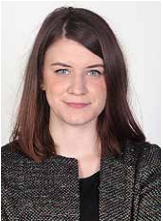
6. EVK DAÁM ALEXANDRA Momentum–DK–MSZP–Párbeszéd–LMP–Jobbik