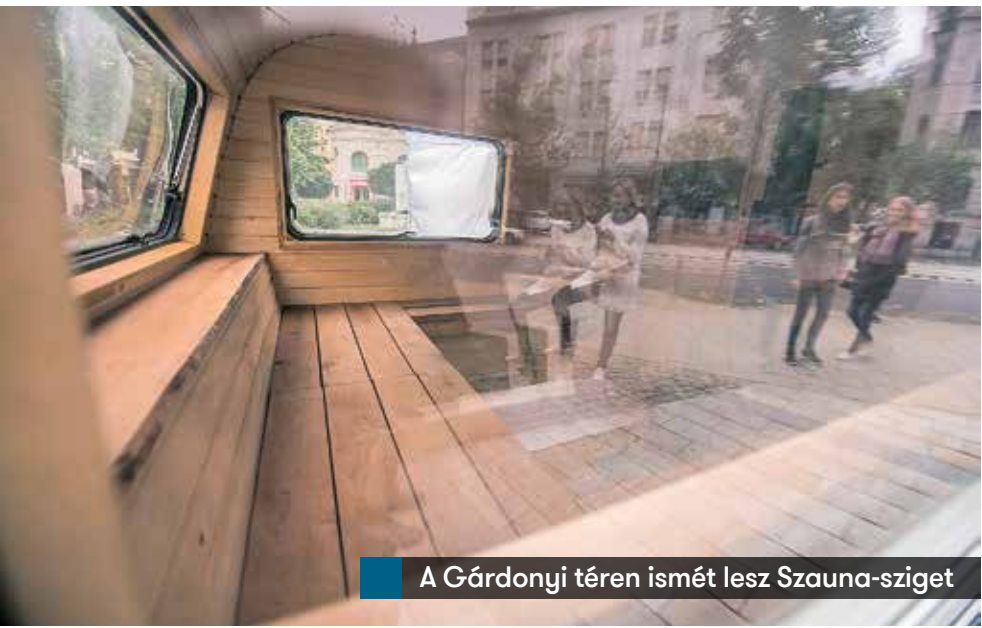
A Gárdonyi téren ismét lesz Szauna-sziget

Az utcák adventi összefogása már elnyerte a Magyar Marketing Szövetség szakmai elismerését, a színvonalas városmarketing tevékenységért járó Városmarketing Gyémánt Díjat. Az együttműködés azt is jelenti, hogy lehet és érdemes is a saját vállalkozás keretein kívülre nézni – vallják a szervezők. A teljes program elérhető a http://bevasarloutca.hu/slowxmas oldalon, a Bartók Béla Boulevard eseményei a www.bartokbelaboulevard.hu oldalon is megtalálhatók.