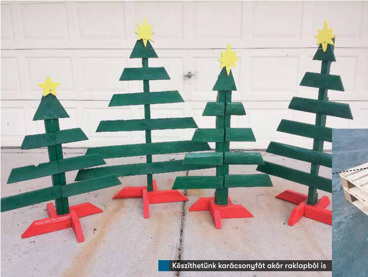
Készíthetünk karácsonyfát akár raklaptól is

A saját készítésű karácsonyfadíszek szokása azokra az időkre nyúlik vissza, amikor nem mindenkinek futotta boltira, elég az aranyozott vagy befestett tobozokra, termésekre gondolni. Sok családban előkerülnek ilyenkor a só-liszt gyurmából formázott, dombornyomott karikák, a papírláncok – akár a gyerekek régi kezemunkái –, vagy a papírból hajtogatott formák, a festett fakorongok, a horgolt angyalok és a gyöngyből fűzött csillagok. De csinálhatunk három pingponglabdából vagy fagolyóból