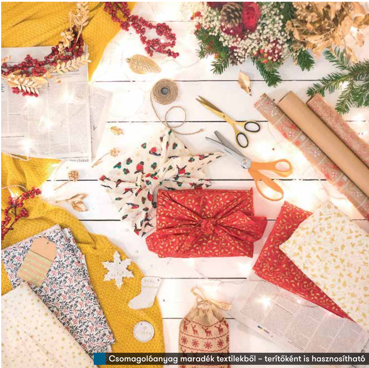
Csomagolóanyag maradék textilekből – terítőként is használható

hőembert, fűzhetünk gombokból minifenyőfát vagy figurákat, különleges díszek lehetnek az arany vagy ezüst színűre festett nagyobb száraztészta, és csomózással, makraméval is érdekes, egyedi formákat alkoshatunk. Igazából szinte bármit be lehet festeni, fel lehet cicomázni úgy, hogy végül csodálatosan mutasson a karácsonyfánk, az pedig a bónusz, hogy a készítés közben családunkkal is jól telik az idő.