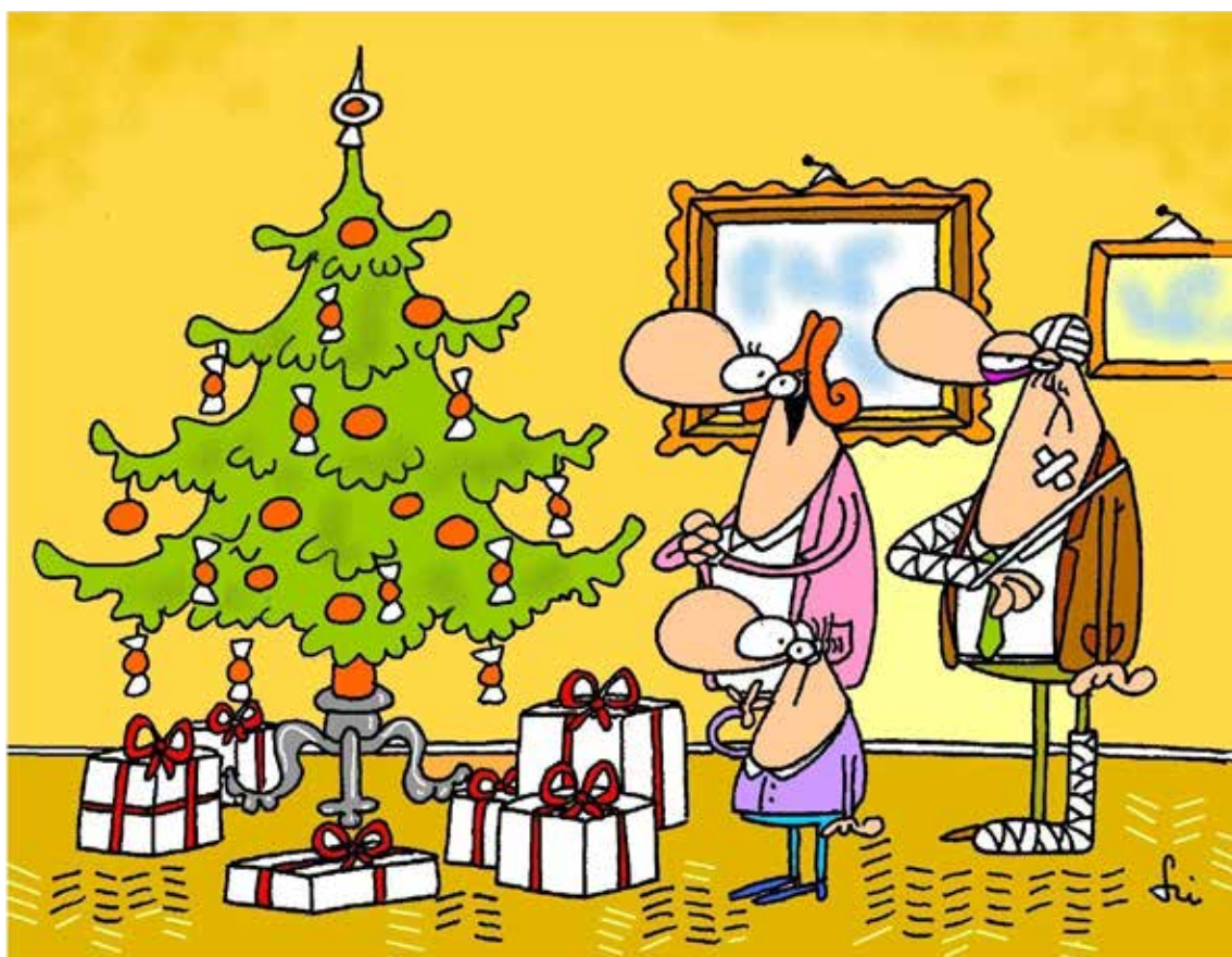
– Nem kéne megigazítani a csúcsdísz, Béla?