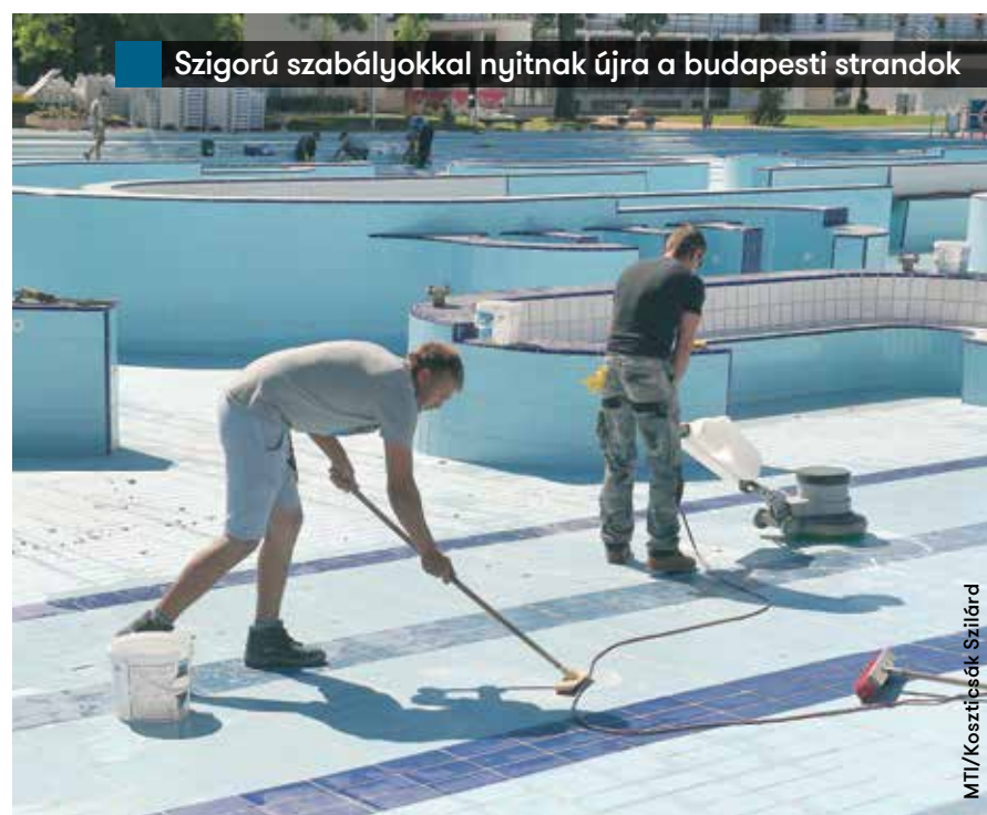
Szigorú szabályokkal nyitnak újra a budapesti strandok