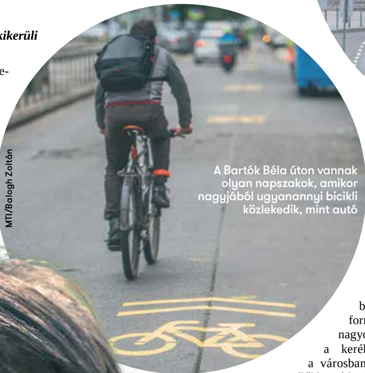
A Bartók Béla úton vannak olyan napszakok, amikor nagyjából ugyanannyi bicikli közlekedik, mint autó

Ezek olyan típusú közútkezelési feladatok, amelyekhez még közgyűlési támogatás sem kell. Egyébként pedig ez az időszak az, amikor tesztfázisba lehet tenni azokat az intézkedéseket, ame-