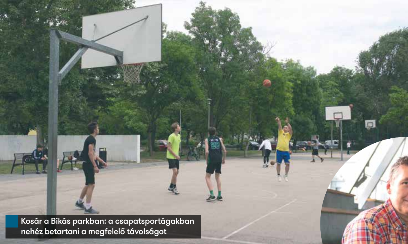
Kosár a Bikás parkban: a csapatsportágakban nehéz betartani a megfelelő távolságot