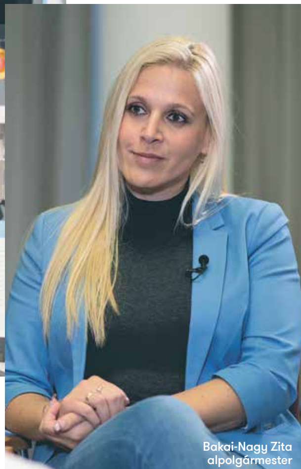
Bakai-Nagy Zita alpolgármester

kellően szabályozva ezek használata, előfordul, hogy a közlekedésben inkább fennakadásokat okoznak, ahelyett, hogy minőségi alternatívát kínálnának. Itt, Újbudán tervezzük az elektromos töltőállomások bővítését, hogy ezáltal is többeket ösztönözzünk elektromos autó vásárlására. Az önkormányzatnak is vannak ilyen járművei. Fontos kérdés a környezetbarát tömegközlekedés is, hogy előnyben tudjuk részesíteni a környezetkímélőbb villamost és a metrójáratokat. Ehhez egy bizonyos szemléletváltásra is szükség lehet.