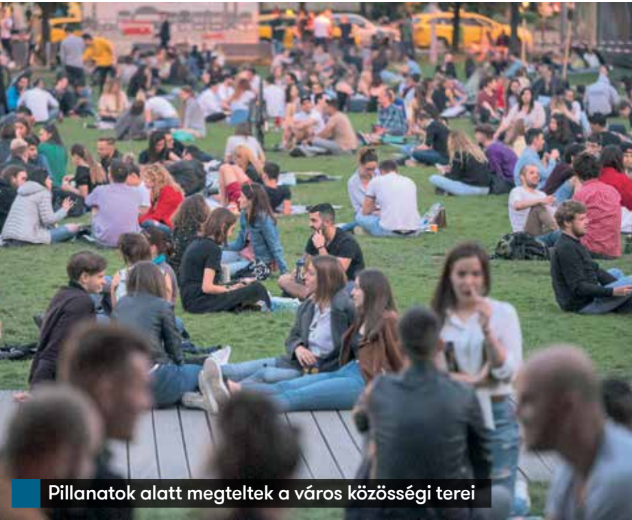
Pillanatokat alatt megteltek a város közösségi terei

vetlenül egymás mögötti helyeket sem lehet elfoglalni. A nézők kötelesek megtartani a védőtávolságot egymástól, különösen az ott található vendéglátóhelyeken, a páholokban, valamint ott is, ahol nincsenek ülőhelyek. A rendezvényeken a szervezőknek nem kell vizsgálniuk a résztvevők fertőzöttségét – tájékoztatott az operatív törzs munkatársa. Mint Kiss Róbert alezredes elmondta, ilyen kötelezettségük nincs a szervezőknek, a védelmi intézkedések feltételeinek megteremtése és a szabályainak betartatá-