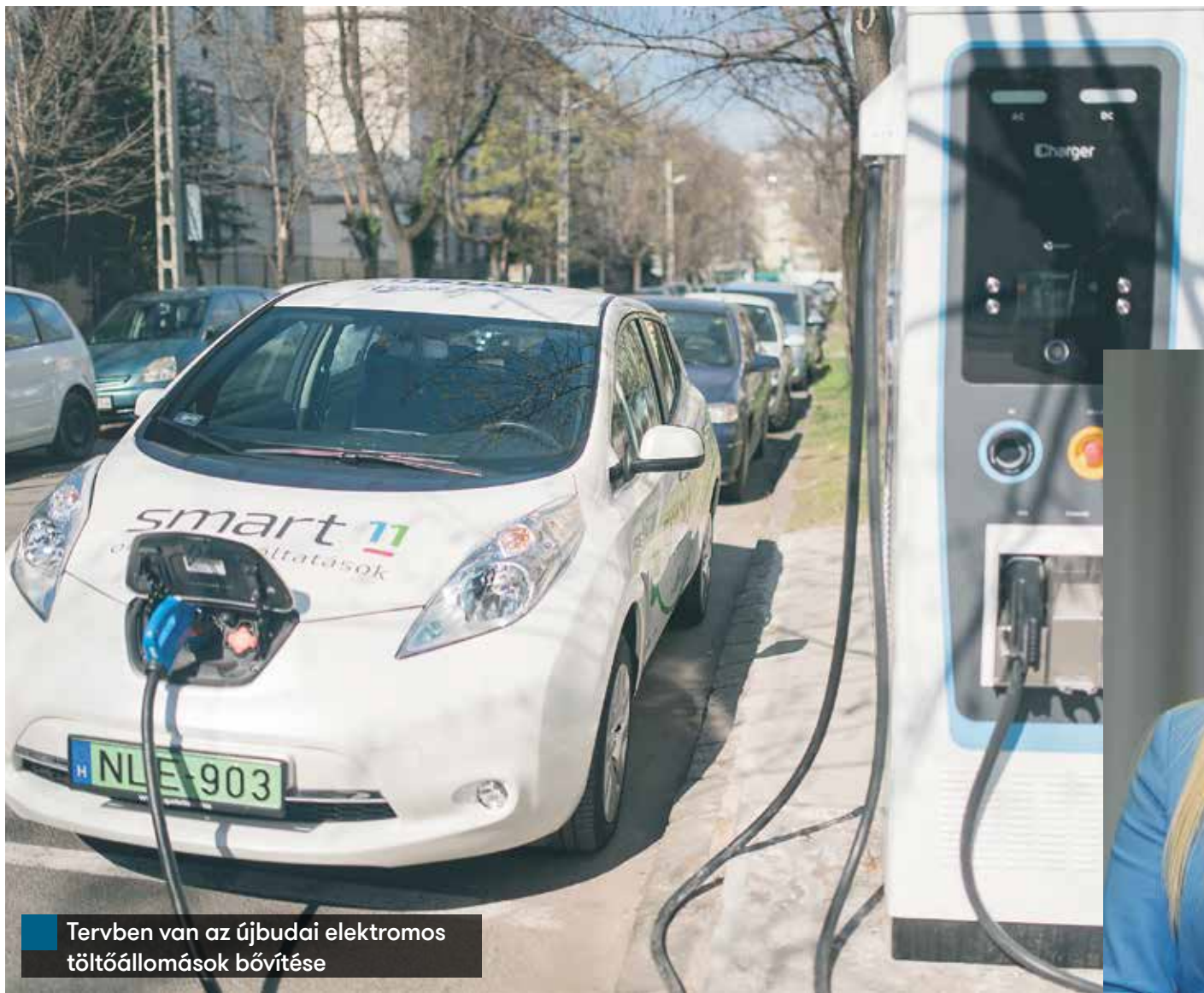
Tervben van az újbudai elektromos töltőállomások bővítése

A felnövő korosztály érzékeny a környezetvédelemre