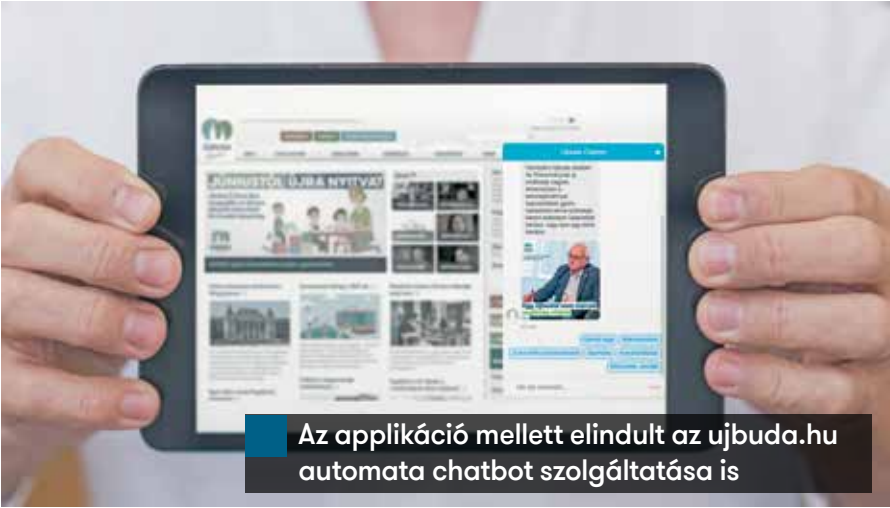
Az applikáció mellett elindult az ujbuda.hu automata chatbot szolgáltatása is

– A közeljövőben tervezzük az applikáció funkcióbővítését – mondta el Görög András, az önkormányzat informati-