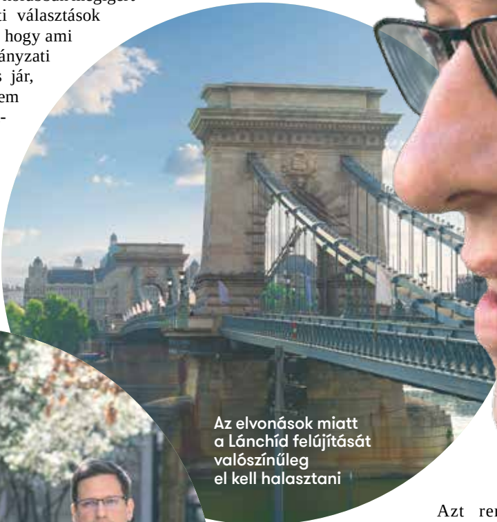
Az elvonások miatt a Lánchíd felújítását valószínűleg el kell halasztani

"Hogyan lehet akkor spórolni? Mit lehet lehúzni a listáról?"