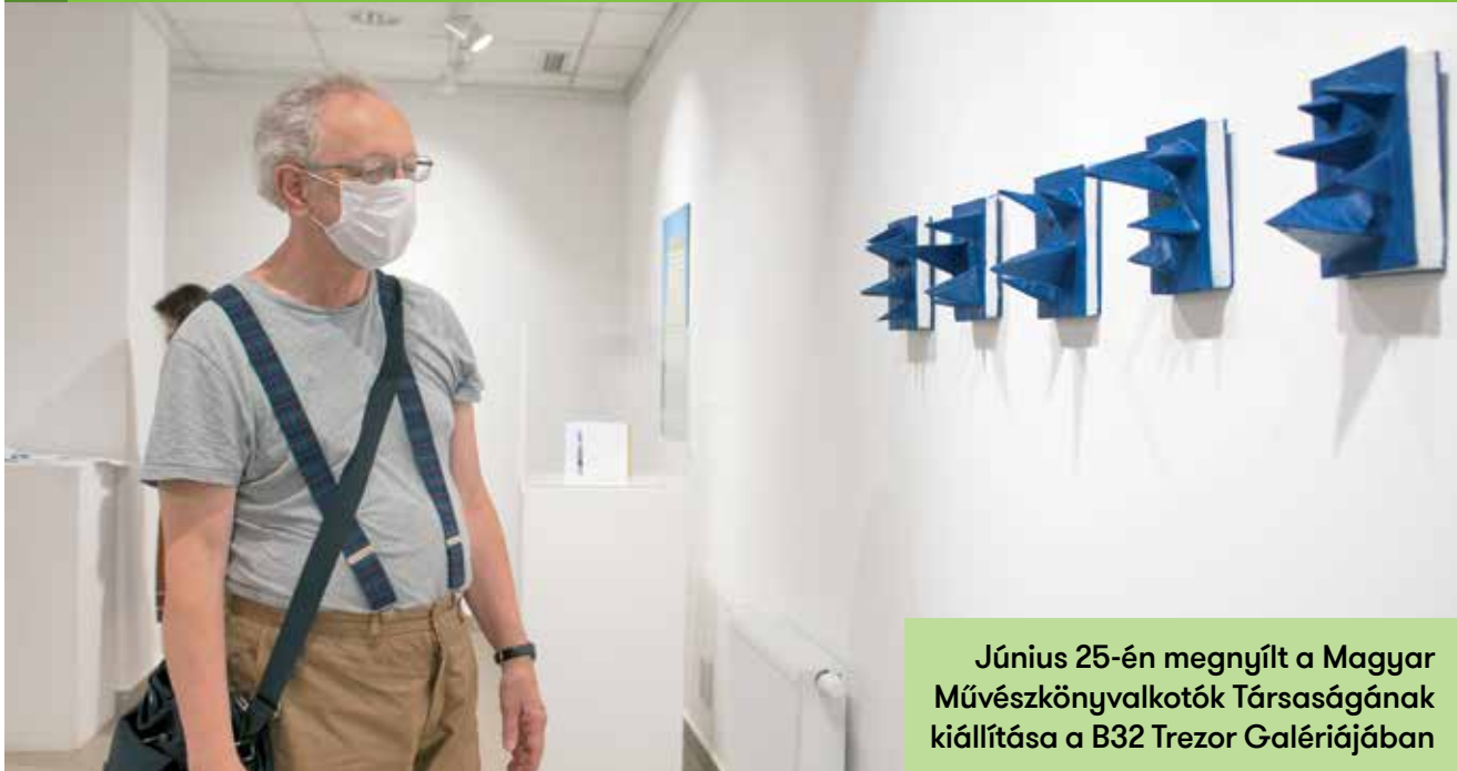
Június 25-én megnyílt a Magyar Művészkönyvalkotók Társaságának kiállítása a B32 Trezor Galériájában