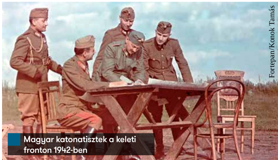
Magyar katonatisztek a keleti fronton 1942-ben