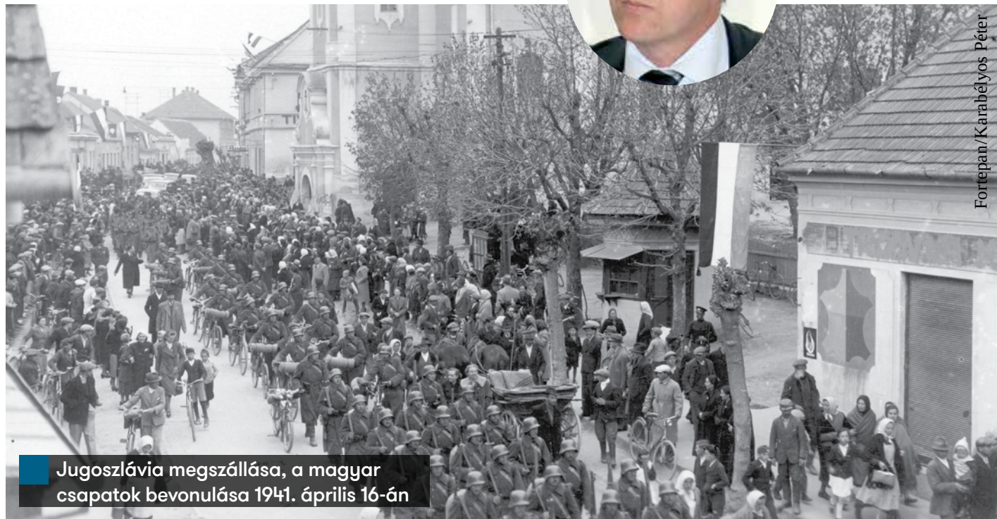
Jugoszlávia megszállása, a magyar csapatok bevonulása 1941. április 16-án

» A könyvében vannak hivatkozások arra, hogy egy darabig a szövetséges hatalmak, ideértve a Szovjetuniót is, azt mondták: ha Magyarország időben kilép a háborúból és más poli-tikát folytat, ha nem marad Németország szövetségese, akkor megtarthat valamit abból, amit visszaszerzett a