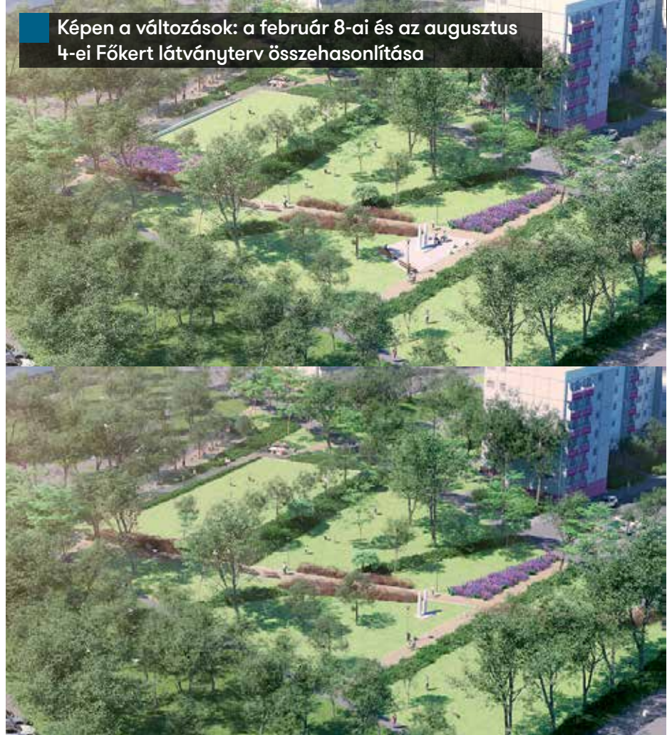
Képen a változások: a február 8-ai és az augusztus 4-ei Főkert látványterv összehasonlítása

síthatják, noha a fejlesztés már elkezdődött. Augusztus első felében újabb egyeztetés volt a lakosok tárgyaló delegációja és a Főkert között.