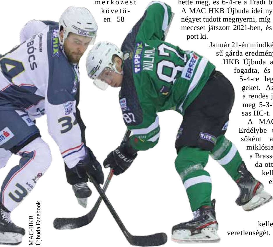
MAC-HKB Újbuda Facebook

Nagy meneteléssel bizonyított a hazai meccseit jelenleg a Tüskecsarnokban játszó FTC Telekom, valamint a MAC HKB Újbuda. A Fradi 27 lejátszott mérkőzést követően 58