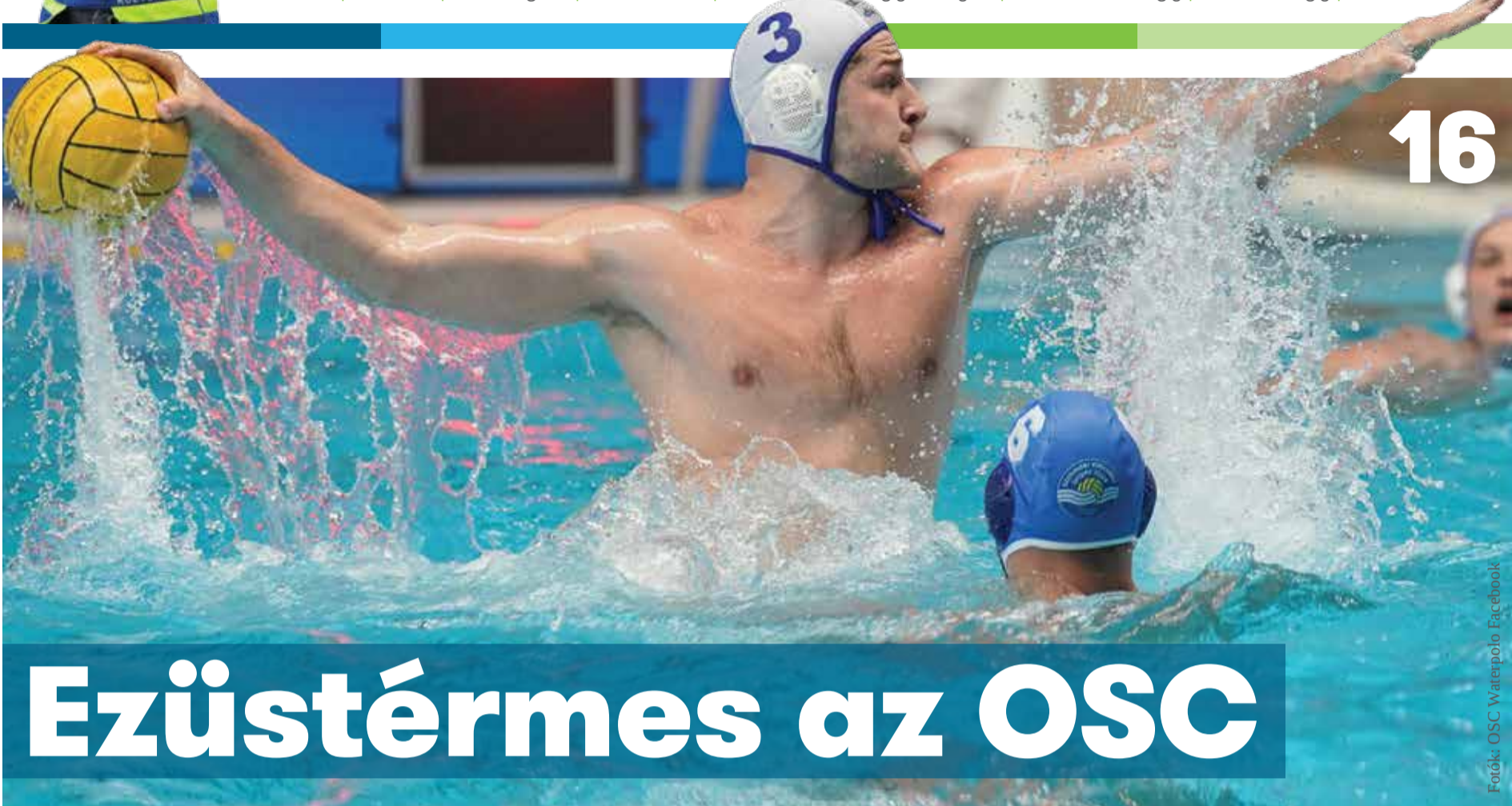
Fotó: OSC Waterpolo Facebook