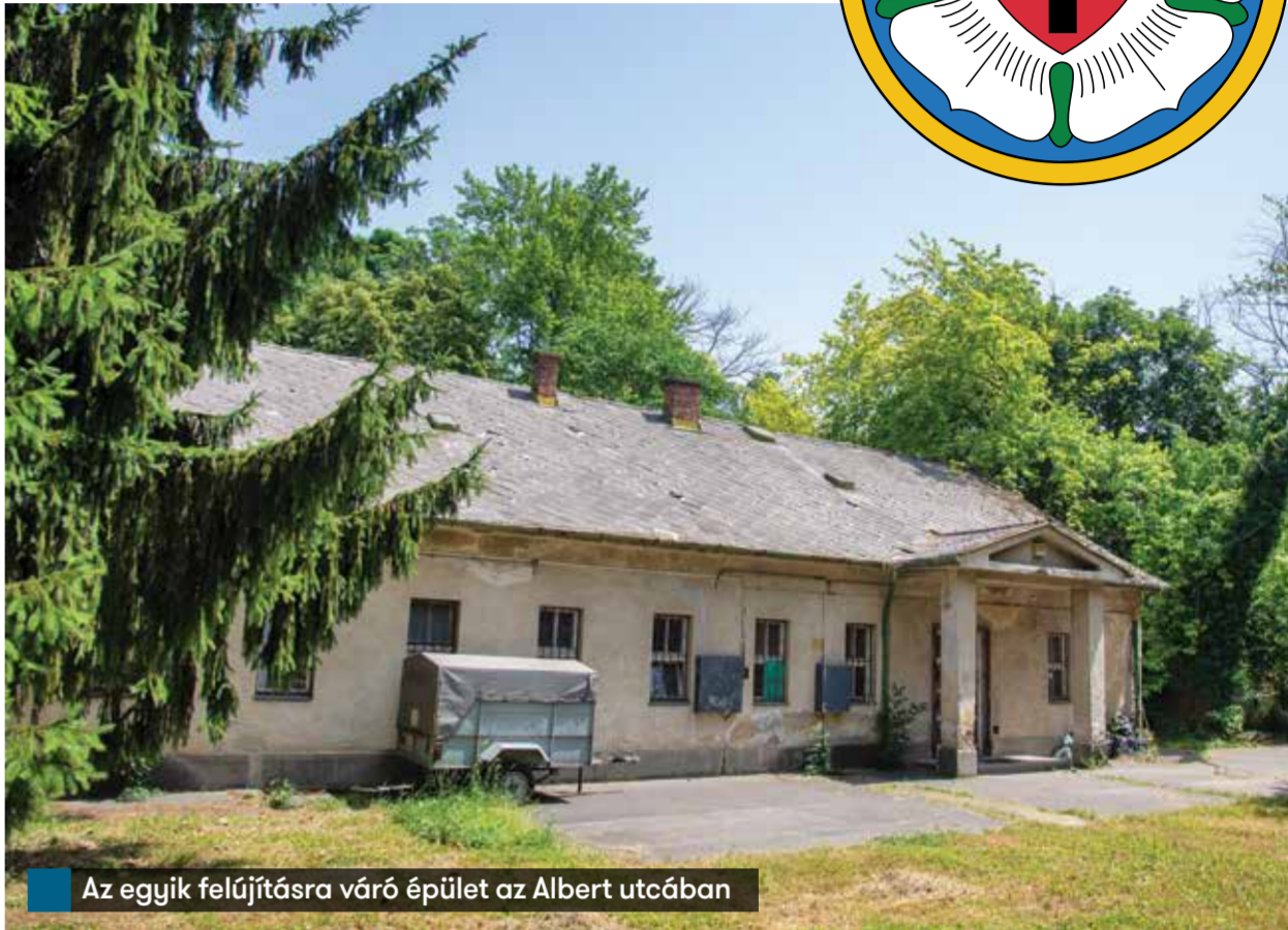
Az egyik felújításra váró épület az Albert utcában